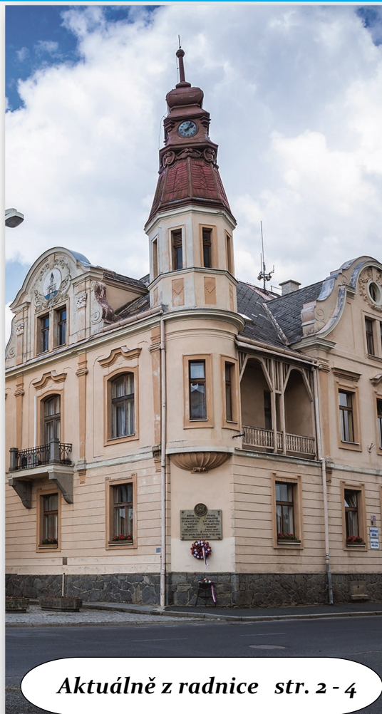
Aktuálně z radnice str. 2 - 4

kterak stromy vítr čistí, aby země mohla spát.