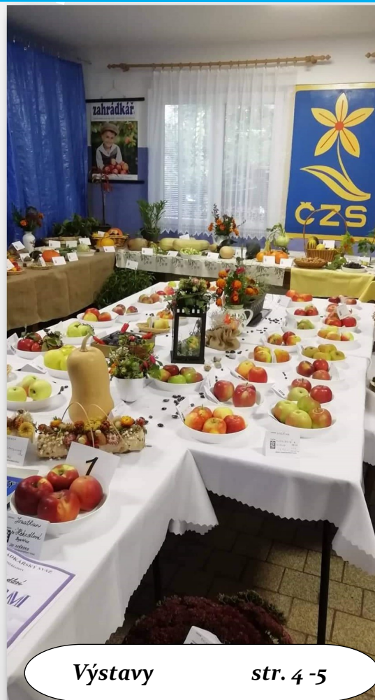
Výstavy str. 4 - 5