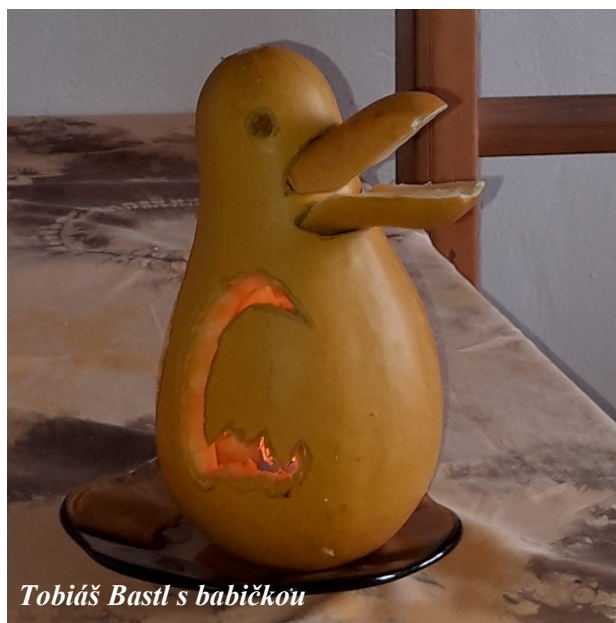
Tobiáš Bastl s babičkou