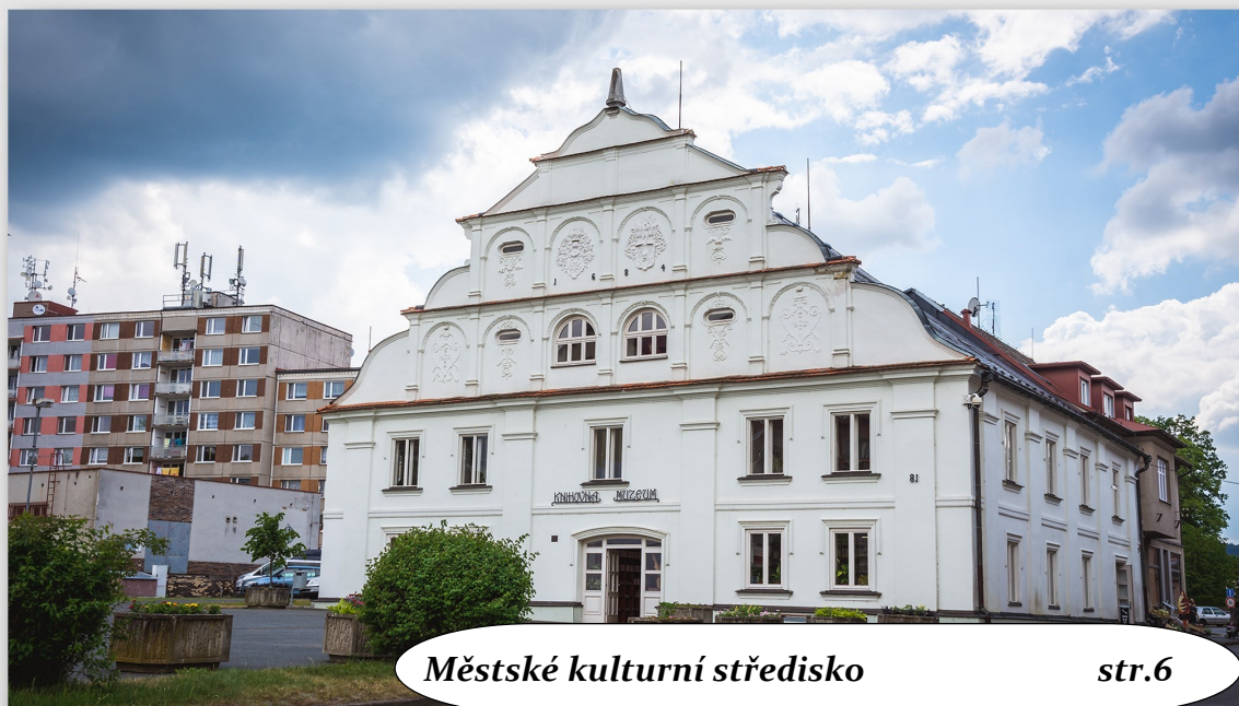
Městské kulturní středisko